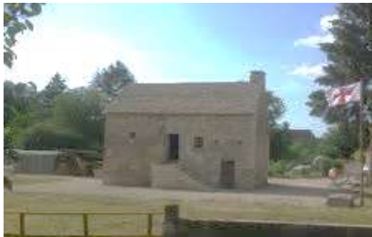
Maison de Guet de L'Orée de l'Oze

Au départ de Dijon, cap à l'ouest ... sur les routes de l'Auxois pour une découverte du patrimoine local. La maison de Guet (l'orée de l'Oze), puis le Musée de la Tuilerie des Granges sous Grignon après un déjeuner pique-nique au bord du canal. Le pot de l'amitié pour conclure cette journée, café des Acacias à Ahuy. Environ 160 kms de plaisir.