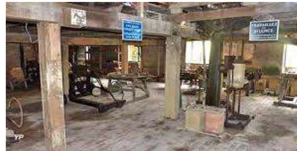
Musée de la Tuilerie Granges sous Grignon